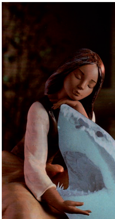
ARCANO XI, LA FUERZA. DE LA SERIE EL TAROT DEL IMPRUDENTE. COLLAGE SOBRE PAPEL, 2007.