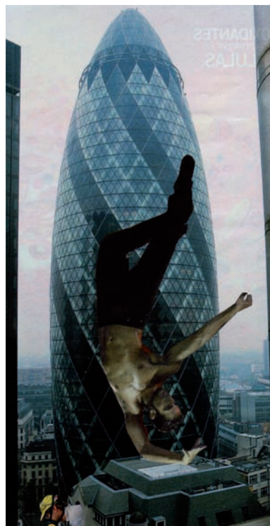
ARCANO XVI, LA TORRE. DE LA SERIE EL TAROT DEL IMPRUDENTE. COLLAGE SOBRE PAPEL, 2007.