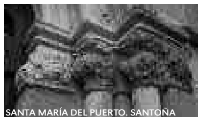
SANTA MARÍA DEL PUERTO. SANTOÑA

Dejando atrás los municipios de Laredo y Castro Urdiales, el municipio de Guriezo se extiende en torno al río Agüera, que lo cruza de sur a norte dando lugar al valle del mismo nombre.