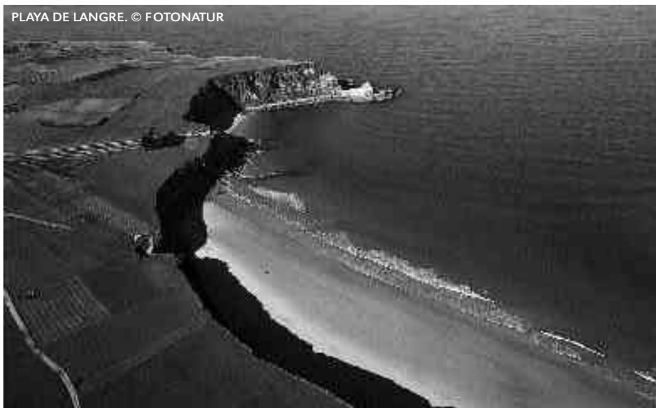
PLAYA DE LANGRE.

En Castro Urdiales y sus alrededores, encontramos los arenales de Arenillas, Dícido, Oriñón, Brazomar y Ostende, éstas dos últimas en el propio núcleo urbano. En el municipio vecino de Liendo, sobresale la bellísima playa de San Julián, pequeña y escondida cala rodeada por agrestes peñas a la que se accede desde la localidad de Villanueva.