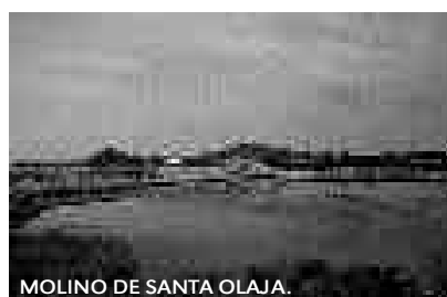
MOLINO DE SANTA OLAJA.