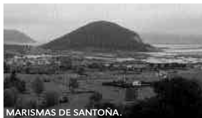
MARISMAS DE SANTOÑA.

Pero el verdadero patrimonio de Laredo reside en su excepcional naturaleza: de un lado, la playa del Regatón, que se despliega en el área interna de la ría de Treto; en el otro, el fantástico conjunto de playa y dunas que forma la denominada Salvé, frente al mar Cantábrico, y en el que ondea la prestigiosa bandera azul que concede la Unión Europea. En el valle cerrado de Liendo , entre Laredo y Castro Urdiales, merece visitarse la iglesia que, con la de Guriezo, forma un dúo monu-