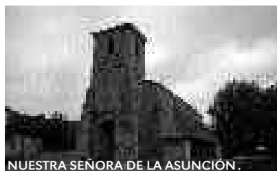
NUESTRA SEÑORA DE LA ASUNCIÓN.

El Observatorio del Arte, ubicado en unas antiguas escuelas, junto a la iglesia de la Asunción de Arnüero, da a conocer la historia de los maestros y artesanos que salieron de estas tierras. El entorno natural representa uno de los pilares del Ecomuseo y una de sus pie-